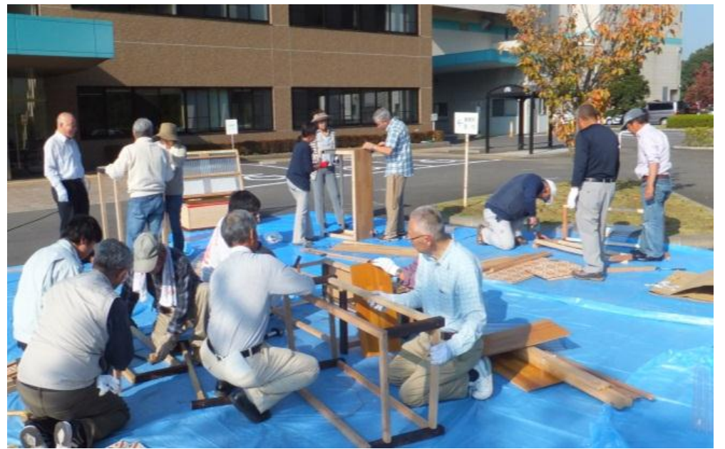
キエーロ製作時の様子