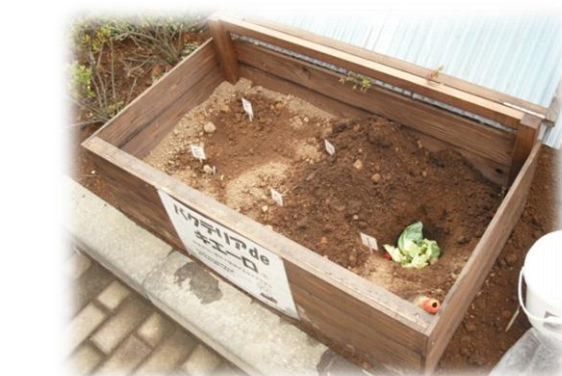
①穴を掘って土に埋める