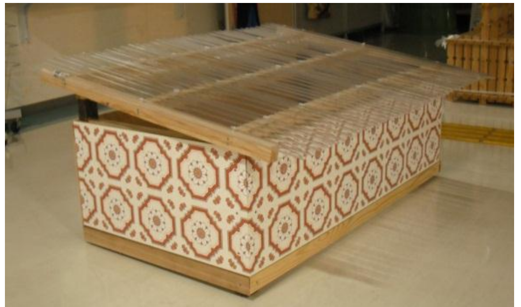
標準的な大きさは幅110cm×奥行60cm×高さ45cm程度

設置場所等の広さに合わせた小さいサイズのキエーロを作成することも出来ますので、ご相談ください。